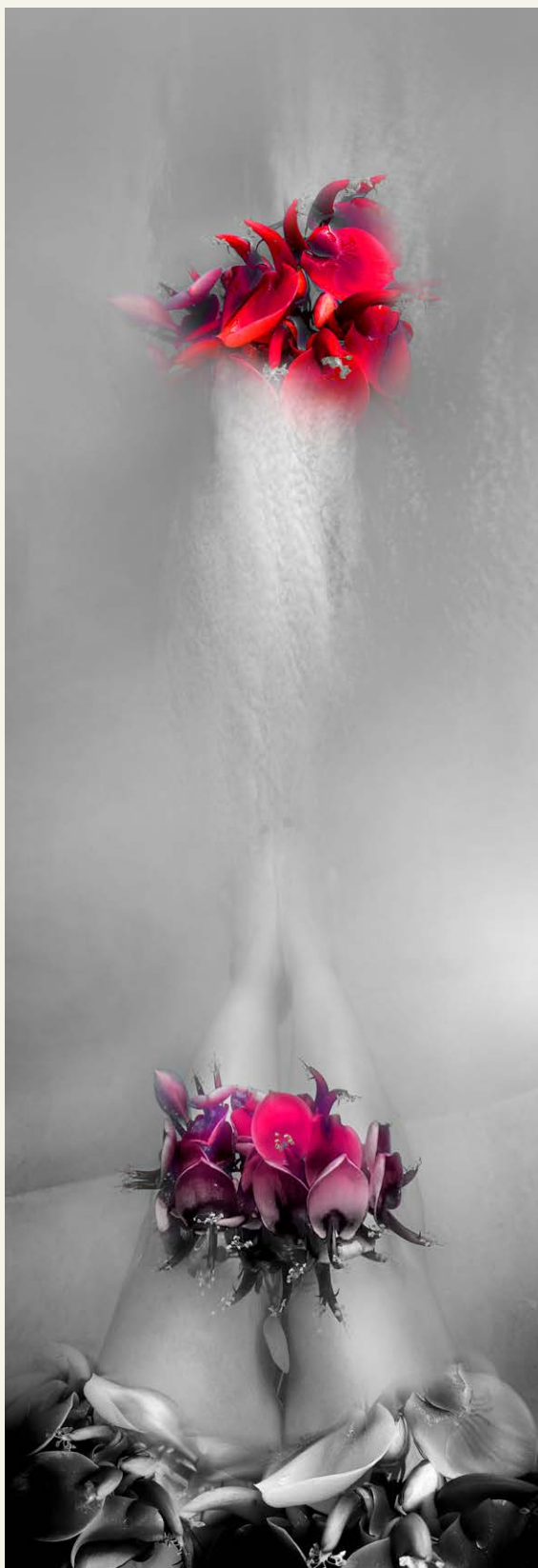
S/D , de la serie Laberinto de pasiones (2025) Fotografía intervenida digitalmente, sublimación sobre seda 136 x 58 cm