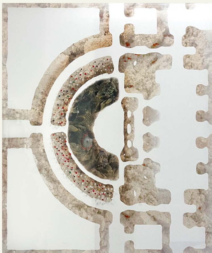
S/D , de la serie En el jardín de las diferencias (2019) Fotomontaje digital, impresión en papel metalizado e intervención con alfileres 63 x 61 x 6 cm.