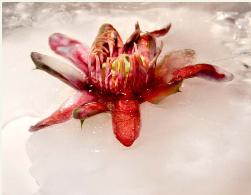
PASIONARIA , de la serie En el jardín de las diferencias (2019) Fotografía digital, impresión en papel metalizado 36 x 30 x 6 cm.