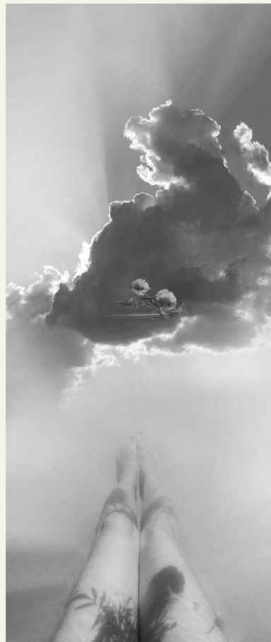
S/D , de la serie Laberinto de pasiones (2025) Fotografía intervenida digitalmente, sublimación sobre seda 146 x 58 cm