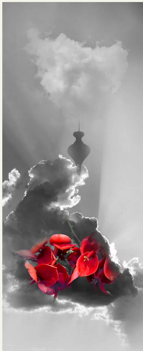
S/D , de la serie Laberinto de pasiones (2025) Fotografía intervenida digitalmente, sublimación sobre seda 136 x 58 cm