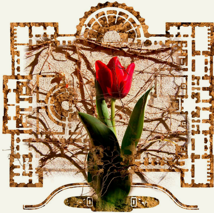
S/D , de la serie En el jardín de las diferencias (2019)

Fotomontaje digital, impresión en papel fotográfico metalizado montada sobre placa de zinc y corte router. Imanes 107 x 107 cm