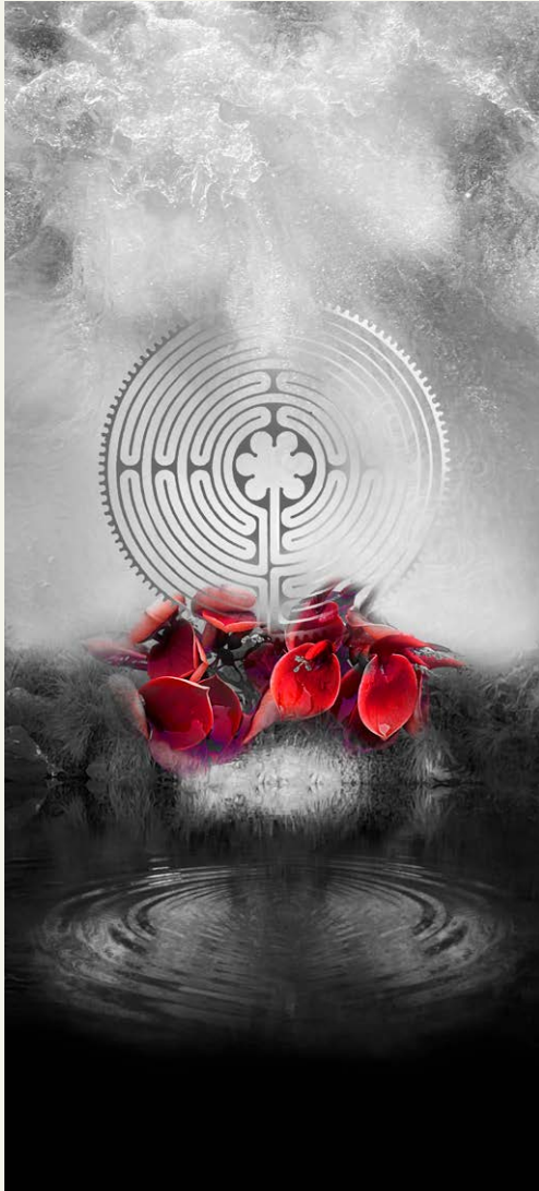
S/D , de la serie Laberinto de pasiones (2024) Fotografía intervenida digitalmente, sublimación sobre seda, montada en caja de acrílico 100 x 54 x 6 cm