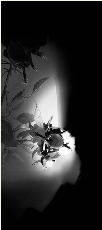
S/D , de la serie Lo que anuncia la luz (2024) Fotografía de toma directa, sublimación sobre seda, montada en caja de acrílico 68 x 36 x 6 cm

Fotomontaje digital, impresión en papel fotográfico metalizado montada sobre placa de zinc y corte router. Imanes 107 x 107 cm