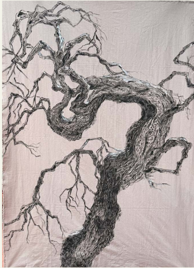
CAPRICHOS Y DESTELLOS, 2024