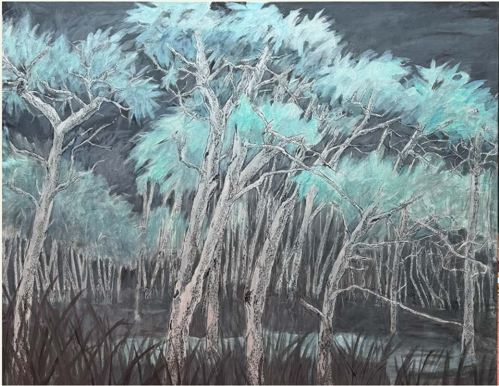
PIENSA EN LA NOCHE, 2024